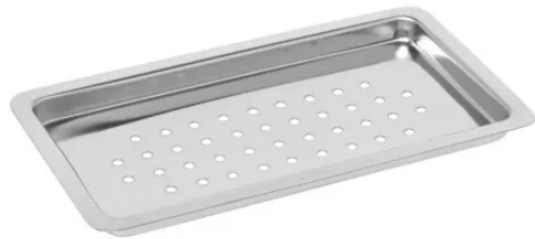
Bandeja Inox 22 x 12 x 01cm Perfurada - Flexinox