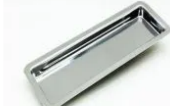
Bandeja Inox 22 x 06 x 1,3cm - Flexinox