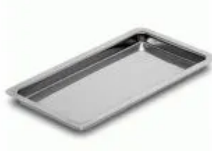
Bandeja Inox 22 x 09 x 1,5cm - Flexinox