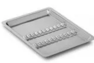
Bandeja Inox 22 x 17 x 1,5cm C/ 12 Divisões - Flexinox